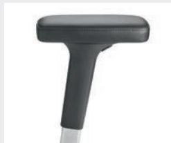
A442APO (4F) Leder-Armauflagen Leather arm pads