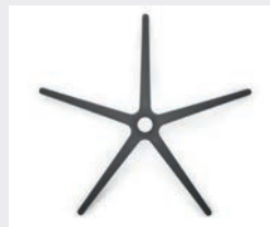
FHKS Kunststoff schwarz (Standard) Black plastic (standard)