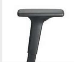
A341KGS / A348KGS* (3F) Armauflagen PU soft Arm pads PU soft