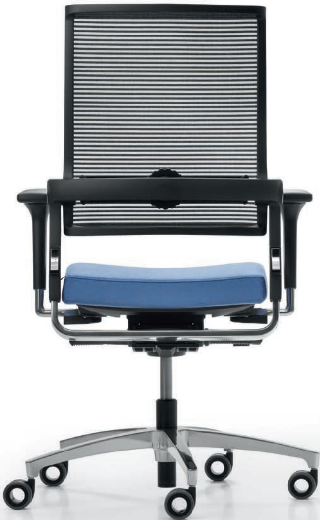
QS LO 3017 + Armlehnen | Armrests A441APO

No matter if you pick a model with or without a neckrest, our Lordo swivel chairs with Syncro-Quickshift® mechanism adapt to the user's natural movement – in perfect harmony. The three-position seat-tilt and seat-depth adjustment combined with four-position synchronised movement enable a healthy and fully ergonomic way of working.