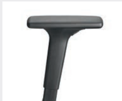
A241KGS (2F) Armauflagen PU soft Armrests PU soft