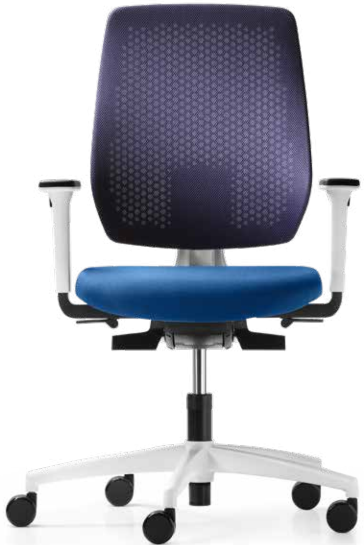
AU SP 7629 style + Armlehnen | Armrests A408KGS