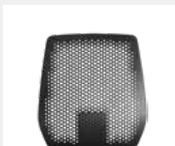
membrane: Hohe, höhenverstellbare Kunststoff-Rückenlehne (58 cm) Standard: Schwarz: (KGS) Option: Weiß: (KVW) High, height-adjustable plastic backrest (58 cm) Standard: black: (KGS) Option: white: (KVW)