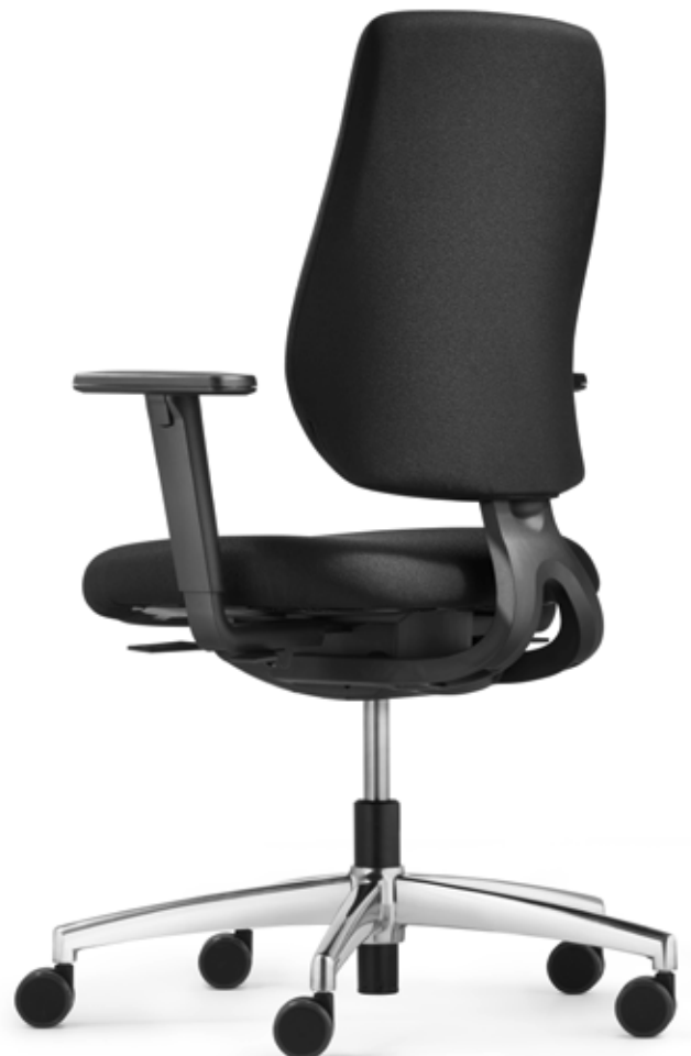
AU SP 7649 comfort plus + Armlehnen | Armrests A408KGS