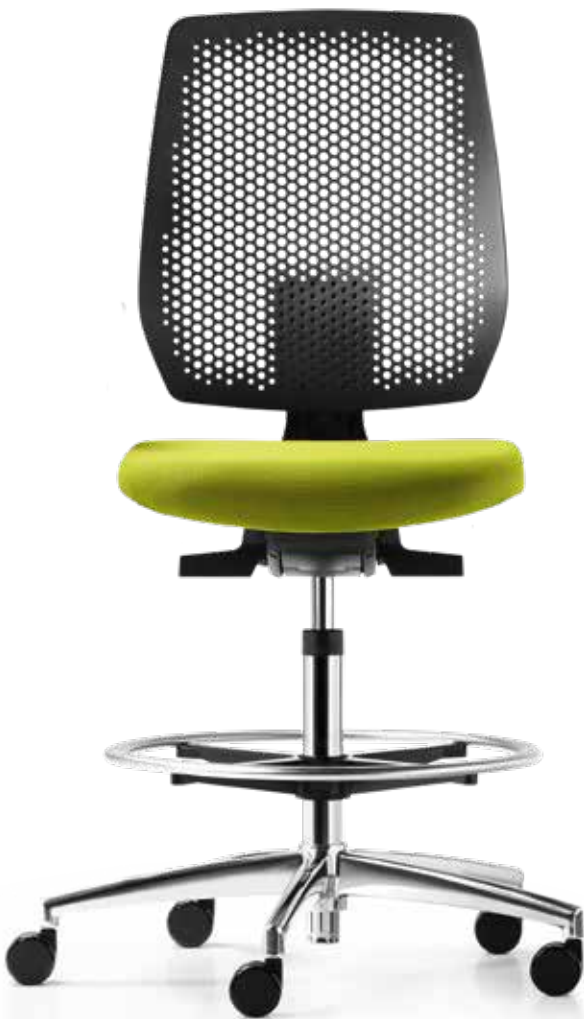
AU SP 7619_CFR membrane