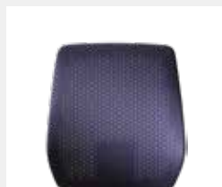
style: Hohe, höhenverstellbare Kunststoff-Rückenlehne (58 cm; rückseitig sichtbar) mit atmungsaktivem 3D-Netzgewebe High, height-adjustable plastic backrest (58 cm; rear side visible) with breathable 3D-mesh fabric