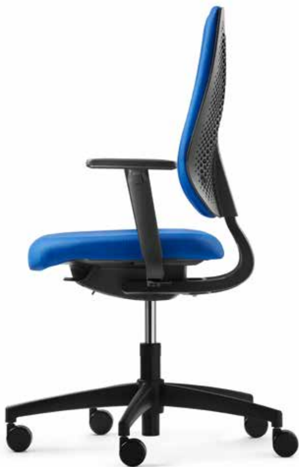
AU SP 7639 comfort + Armlehnen | Armrests A408KGS

speed-o is synonymous with straightforward individuality. The perforated, breathable backrest shell gives the chair a fresh, timeless appearance which is individualised thanks to coloured cushions with textile or mesh covers. The fully upholstered version of the speed-o comfort plus also provides a homely atmosphere at work. Thanks to the Easy Touch system, the height-adjustable backrests can be adjusted conveniently and easily while sitting.