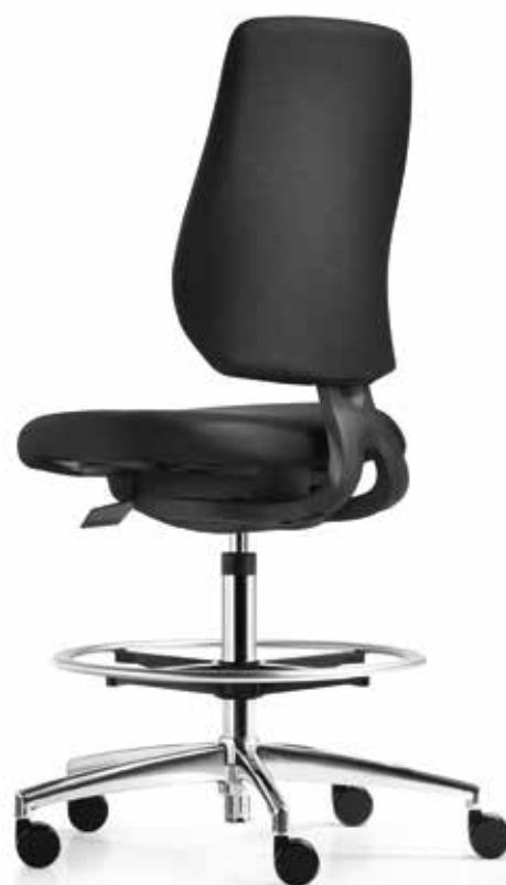
AU SP 7649_CFR comfort plus