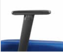
A208KGS (2F) Armauflagen PU soft Soft PU armpads