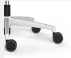
FFAVW Aluminium weiß (Option) Aluminium white (option)