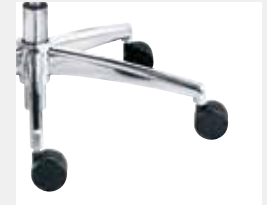
FFAPO Aluminium poliert (Option) Aluminium polished (option)