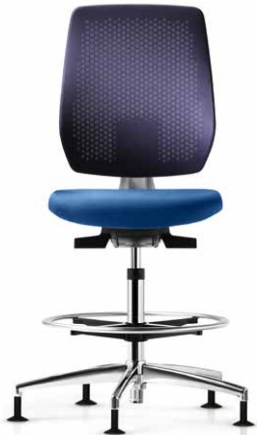
AU SP 7629_CFR style