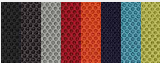
Web M (100% Polyester) Abstandsgewebe (3 mm) in 8 Farben (Option) Spacer fabric (3 mm) in 8 colours (option)