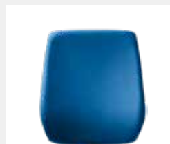
comfort: Hohe, höhenverstellbare Kunststoff-Rückenlehne (58 cm; rückseitig sichtbar) mit Polsterauflage High, height-adjustable plastic backrest (58 cm; rear side visible) with upholstered cushion