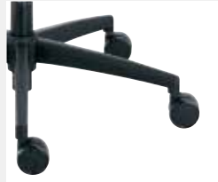
FFKGS Kunststoff schwarz (Standard) Black plastic (standard)