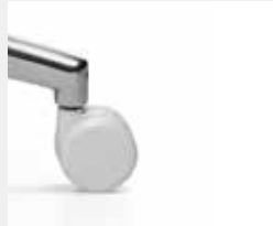
R75HVV (Option) Weiße Rollen, hart für weiche Böden White castors, hard for soft floors