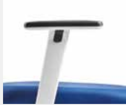
A408KGS (4F) Armauflagen PU soft Soft PU armpads

*Farbe der Armlehnenhülse = Modellfarbe *Colour of armrest cover = model colour